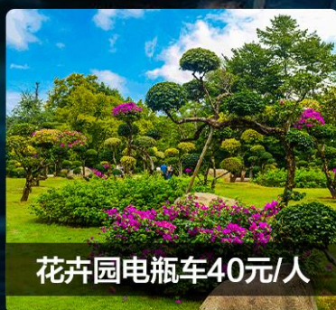
花卉园电瓶车40元/人