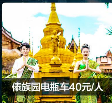
傣族园电瓶车40元/人