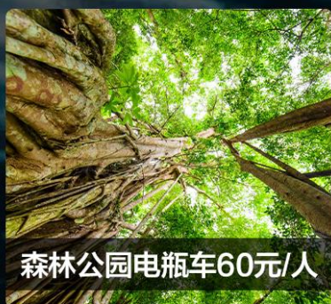
森林公园电瓶车60元/人