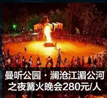
曼听公园·澜沧江湄公河 之夜篝火晚会280元/人