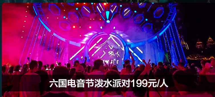
六国电音节泼水派对199元/人