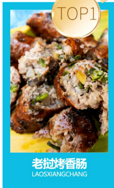
TOP1 老挝烤香肠 LAOSXIANGCHANG