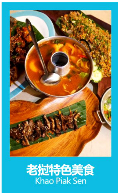
老挝特色美食 Khao Piak Sen