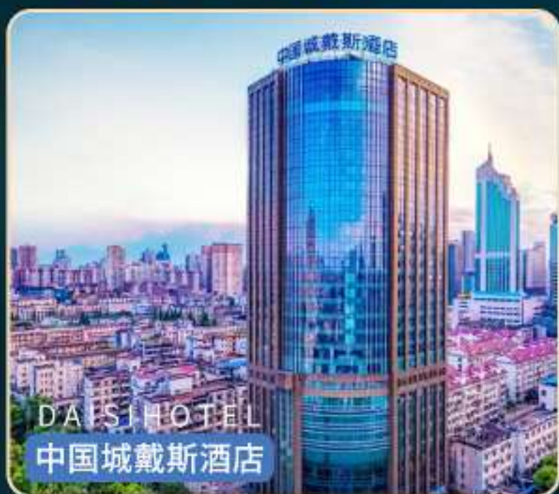
DAISI HOTEL 中国城戴斯酒店