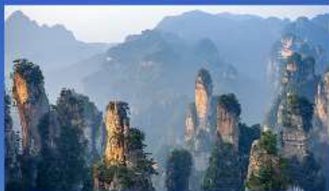
张家界森林公园-国家5A级景区 世界自然遗产、世界地质公园