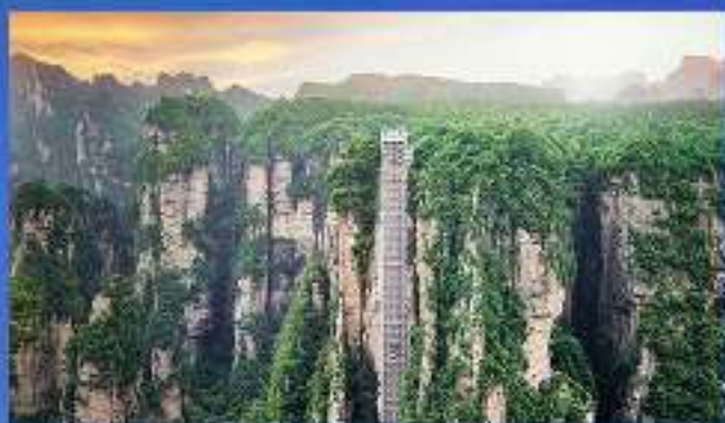
百龙电梯-世界第一电梯 世界上最高、载重量最大 运行速度最快的全暴露户外观光电梯