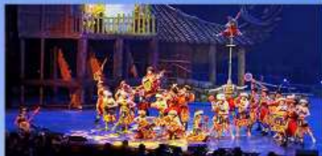
魅力湘西-湘西歌舞晚会 为您重现娱乐盛典，铸造视觉盛况 还原民俗神秘经典