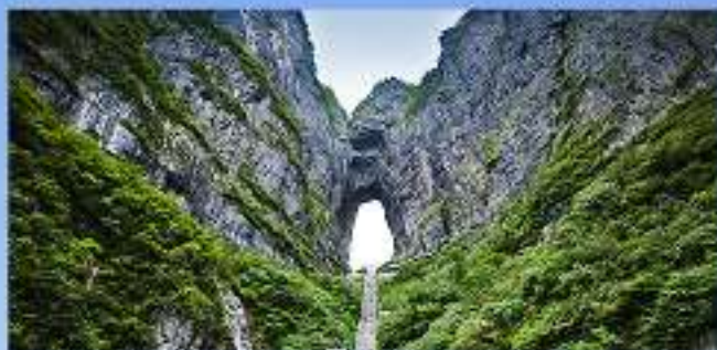
天门仙山-湘西第一神山 黄渤、徐峥主演的电影《玩命邂逅》拍摄地之一