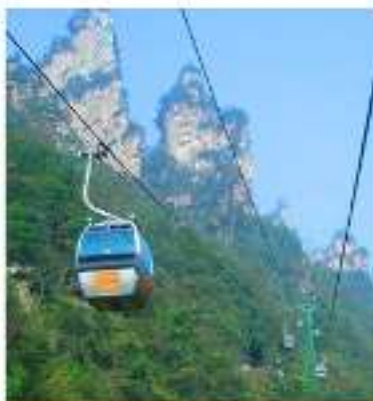
黄金索道 天子山索道上