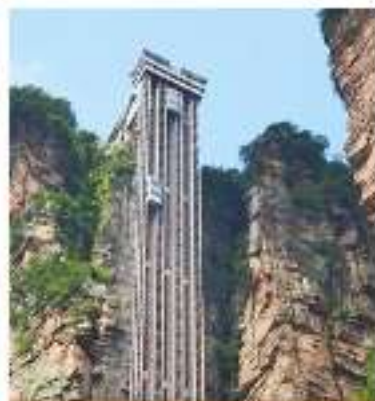
世界天梯 百龙天梯下