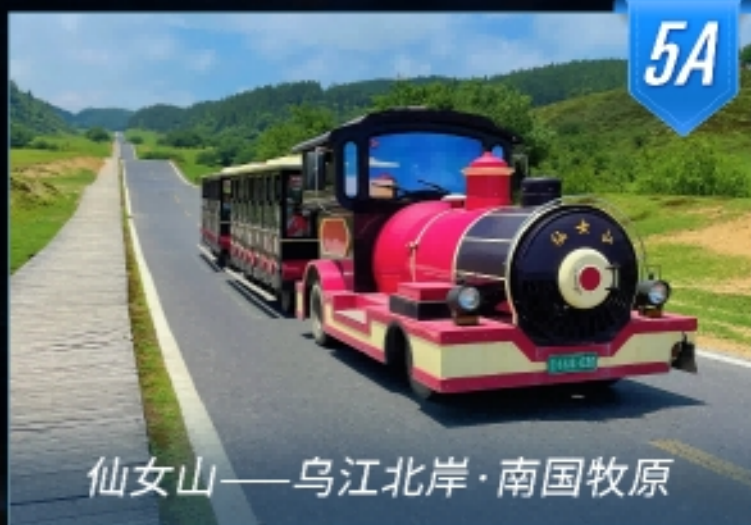
仙女山——乌江北岸·南国牧原