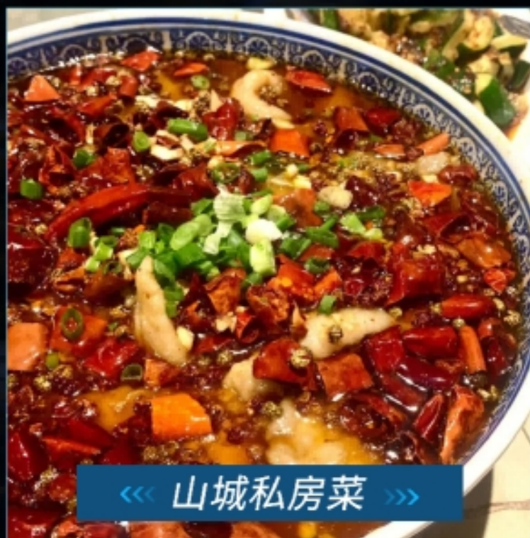
《《 山城私房菜 》》