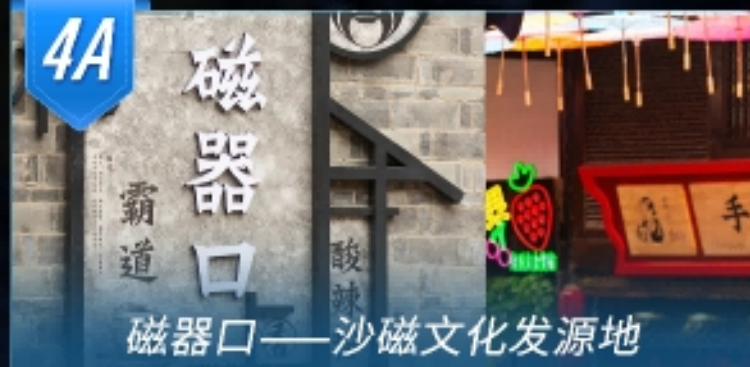
磁器口——沙磁文化发源地