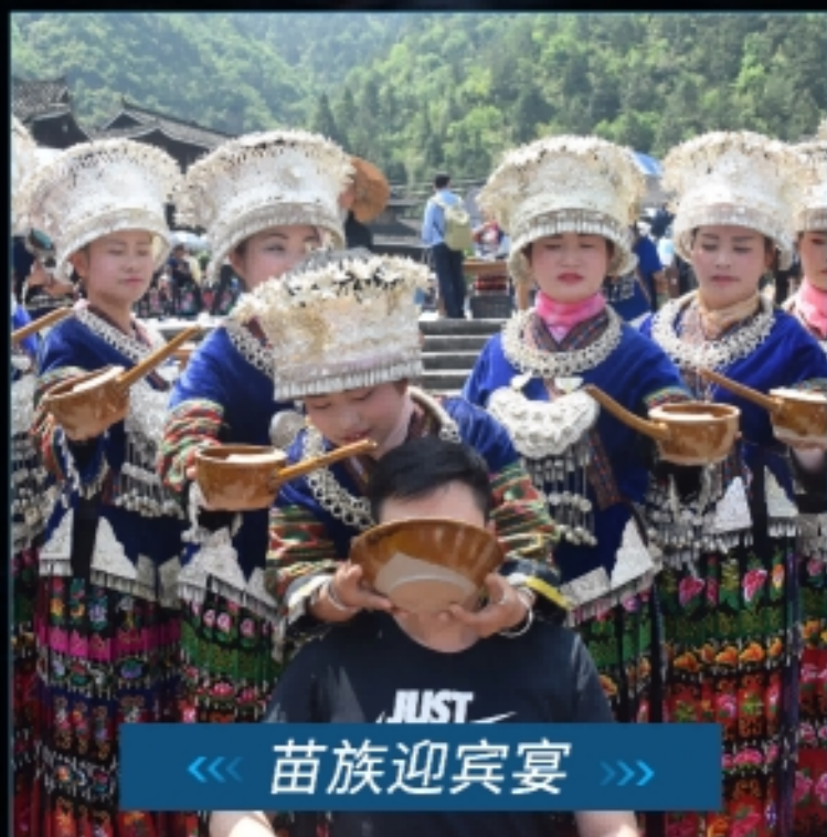
《《 苗族迎宾宴 》》