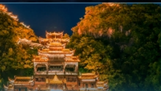
蚩尤九黎城——神秘苗族部落