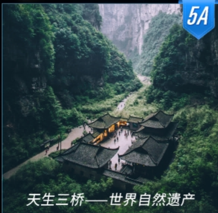
天生三桥——世界自然遗产