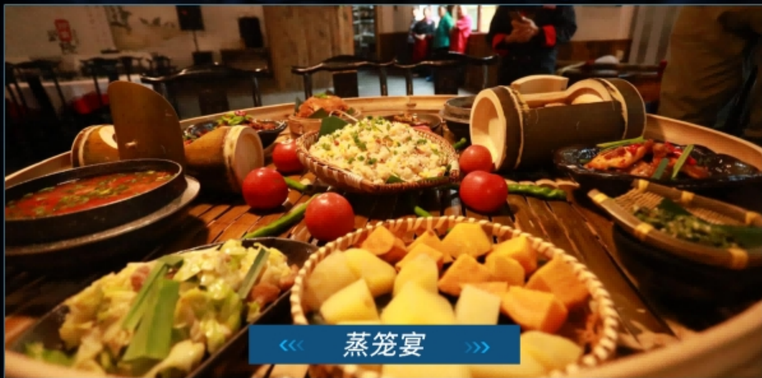
《《 蒸笼宴 》》