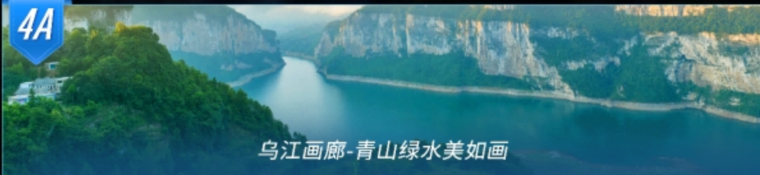
乌江画廊-青山绿水美如画