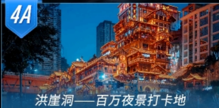
洪崖洞——百万夜景打卡地